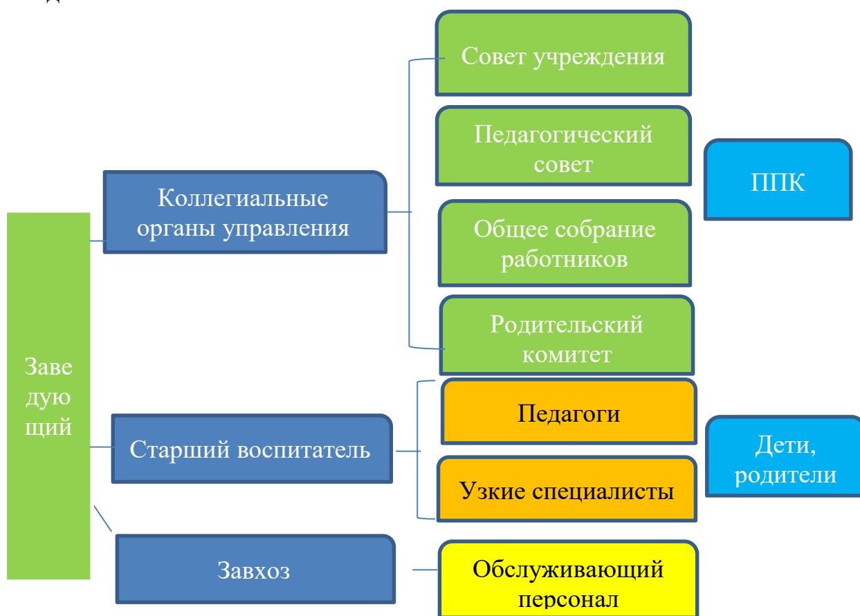
Рисунок № 1. Структура управления ДООУ.

Система управления в ДООУ обеспечивает оптимальное сочетание традиционных и современных инновационных тенденций, что позволяет эффективно организовать образовательное пространство ДООУ. Основные вопросы по управлению учреждением решаются на оперативных совещаниях административного аппарата, текущие на пятиминутках – еженедельно. В образовательном учреждении используются эффективные формы контроля, различные виды мониторинга (управленческий, методический, медико-